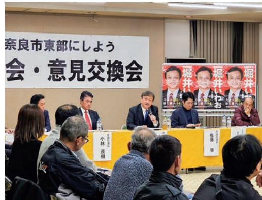
令和6年12月「元気ある奈良市東部にしよう 国政報告会・意見交換会」にて