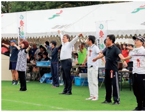
令和6年9月 第17回葛城市民体育祭にて