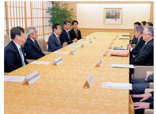
令和6年12月 外交力強化決議について 岩屋外務大臣に申し入れ