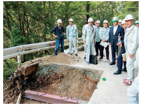
令和6年10月 川上村の崩落現場を視察