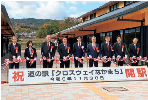
令和6年11月道の駅「クロスウェイなかまち」開駅式典にて