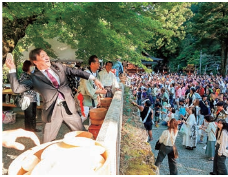
令和6年10月 丹生川上神社中社の餅まきに参加