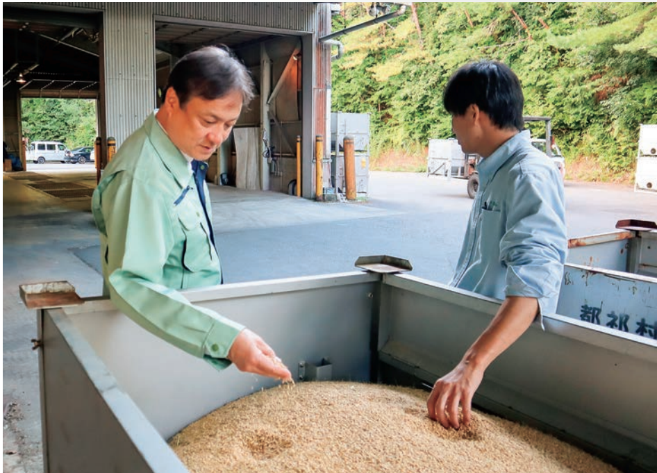
令和6年9月 奈良市都祁のライスセンターを視察