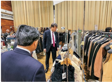
令和6年11月 毛皮革フェア in うたのにて