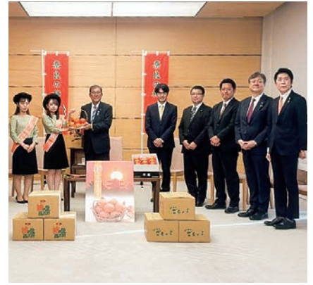
令和6年11月「奈良の柿」PR 首相官邸表敬訪問