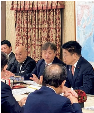
令和6年11月 加藤財務大臣に申し入れ