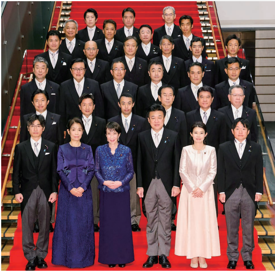
令和7年10月 高市内閣 副大臣集合写真