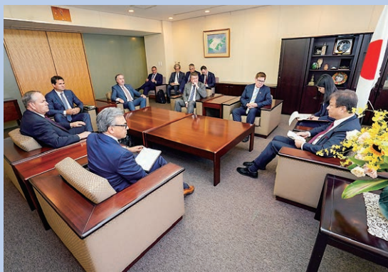
令和7年10月 カナダ・ビジネス評議会 CEO一行と面談