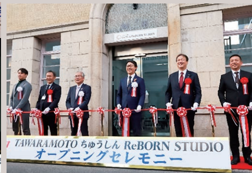
令和7年12月 田原本町のTAWARAMOTO ちゅうしんReBORN STUDIO オープニングセレモニーにて