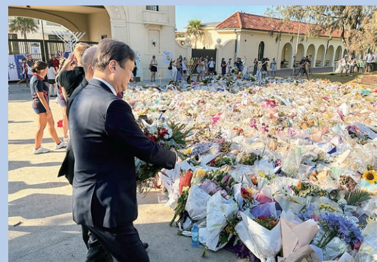
令和7年12月 オーストラリア ボンダイ ビーチにて、ユダヤ教徒へのテロ事件 犠牲者への献花・黙祷