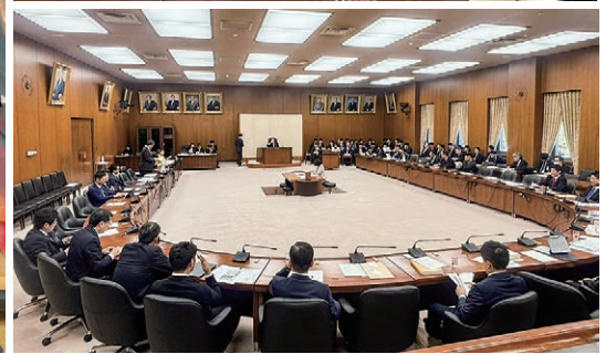
令和7年11月 衆議院総務委員会にて答弁

お健やかに佳き新春をお迎えのことと、心よりお慶び申し上げます。昨年はおかげさまで3期目をスタートさせていただき、本年も皆様のご期待にお応えできますよう、決意を新たに一層の努力を重ねて参る所存でございます。