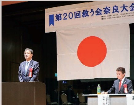
令和7年12月 北朝鮮による日本人 拉致被害者を救う会奈良大会にて