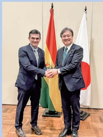
令和7年11月 ボリビア パス大統領 就任式に特派大使として出席