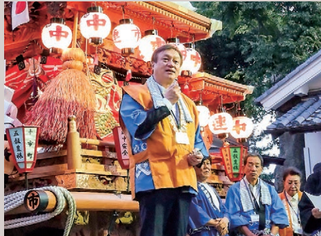
令和7年10月 橿原市十市町秋祭りにて