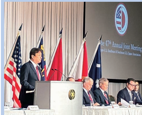
令和7年10月 日本・米国南東部会 日米合同会議にて