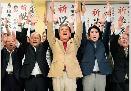
令和7年7月 参議院議員選挙 3期目の当選を果たす