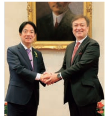
⑫令和6年5月 台湾 頼總統を表敬訪問