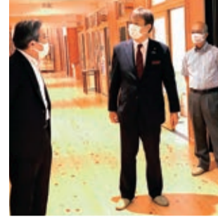
④令和3年8月 下北山村小中学校訪問