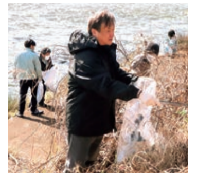
⑨令和6年3月 大和川一斉清掃