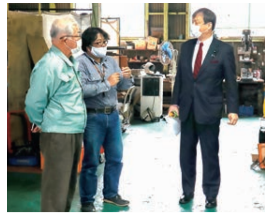
②令和2年11月 大和高田市内の精密機器メーカーにて