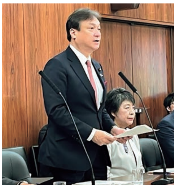
令和5年11月 外務副大臣として 外交防衛委員会にて答弁