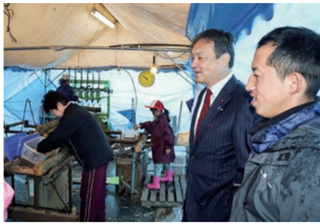
①令和2年2月 吉野郡のシイタケ農家にて

米国（4回）・台湾（4回）・オーストラリア（2回）・グアテマラ・アルゼンチン・シンガポール・フィジー・バヌアツ・スペイン・チリを訪問。各国要人と面会し、外交関係の発展のため尽力。