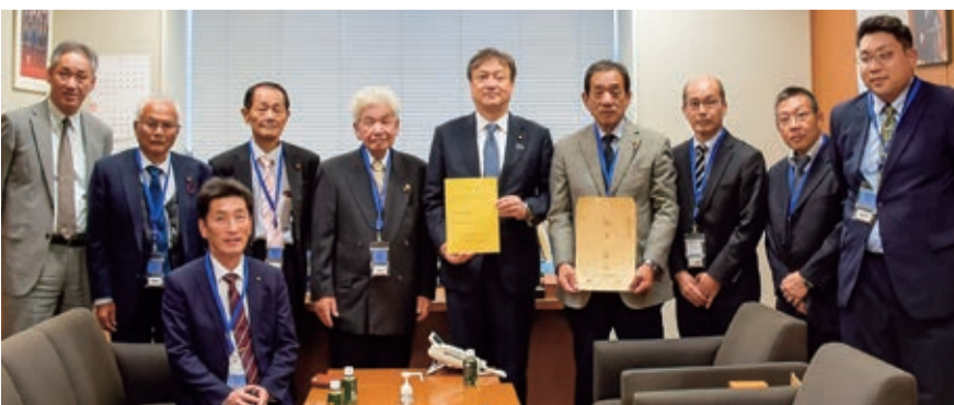
令和6年11月 奈良県農業会議の皆様からご要望をいただく