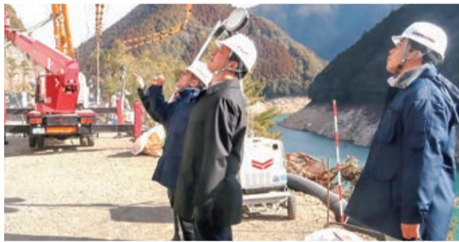
⑧令和6年2月 下北山村国道169号土砂崩れ現場視察