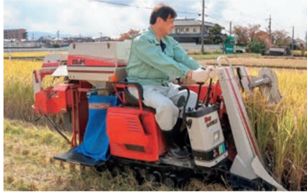
⑥令和4年10月 天理市内にて稲の刈取り作業体験