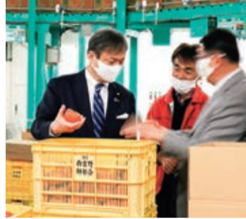
③令和2年11月 五條市西吉野の柿選果場にて