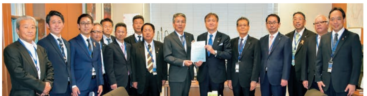
令和6年11月 治水事業促進全国大会に際してのご要望をいただく