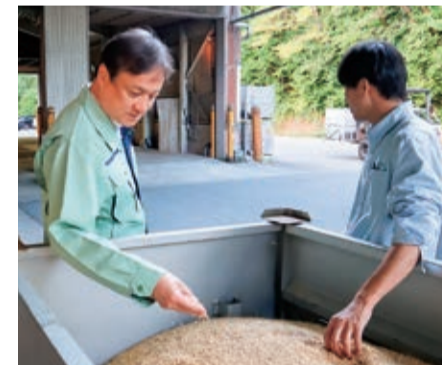
⑪令和6年9月 奈良市都祁のライスセンターを視察