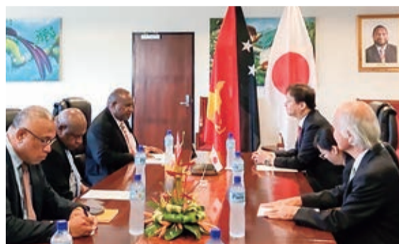
⑬令和5年10月 パプアニューギニア マラペ首相を表敬訪問