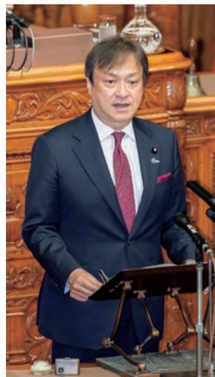
令和5年4月 参議院本会議にて 防衛三文書について質問