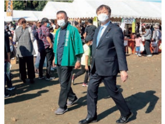
⑦令和4年10月 天理じゃんじゃん市に参加