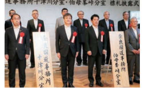
⑤令和4年6月 奈良国道事務所十津川分室・伯母峯峠分室標札披露式典