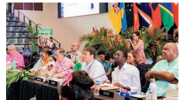
⑭令和5年11月 太平洋諸島フォーラム（PIF）域外国対話出席