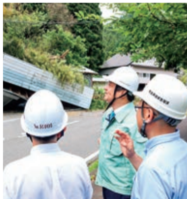
⑩令和6年7月 国道369号曾爾村地内崩落現場視察